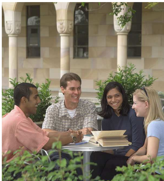
Sprachschüler am Sprachzentrum der University of Queensland, Brisbane

STA Travel, der Spezialanbieter für Studentenflüge, wird Ihnen als unser Partner-Reisebüro automatisch anhand der Daten aus Ihrer Anmeldung ein unverbindliches Flugangebot erstellen und dieses vorreservieren. Sie entscheiden dann selbst, ob Sie diesen Flug in Anspruch nehmen möchten.